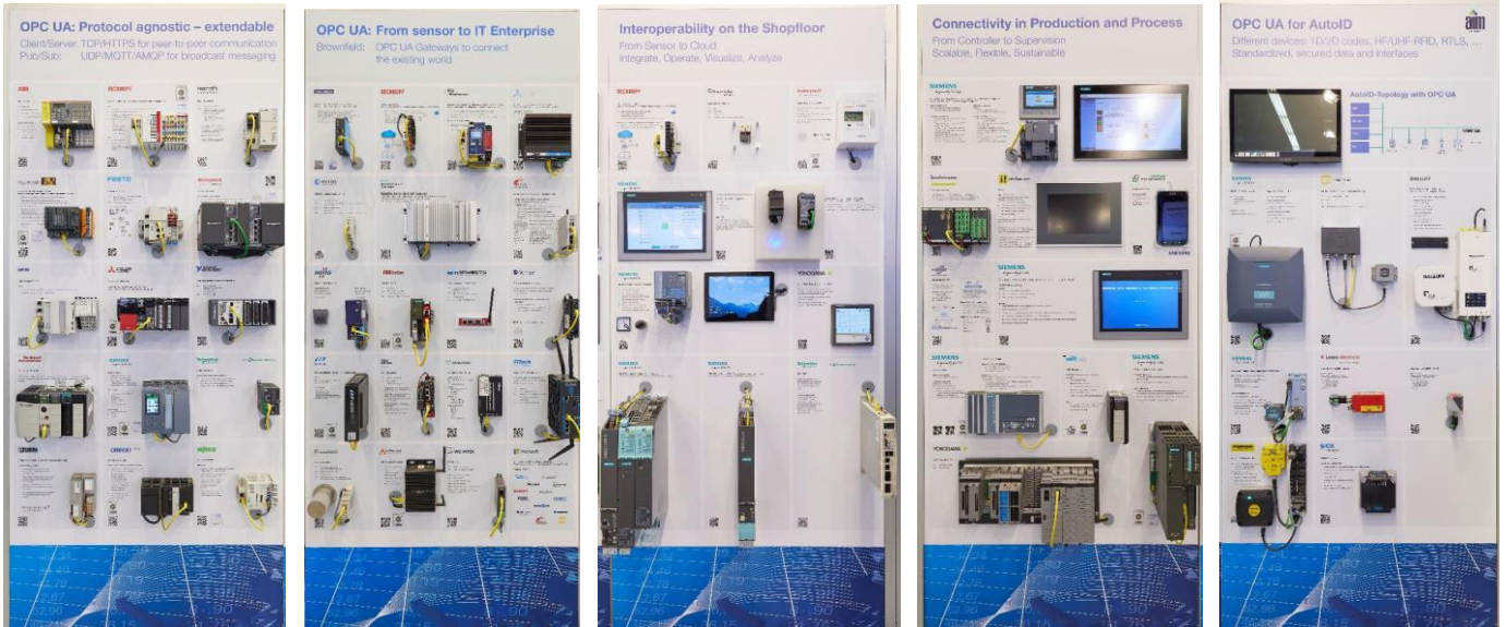
European Demo wall @ SPS IPC Drives 2016

本文档是关于如何使您的公司 LOGO 与您的 OPC 设备能够参与到该演示墙。 请注意，此机会仅适用于 OPC 会员。